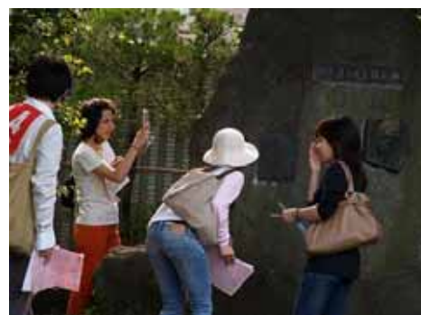
国际交流步行比赛