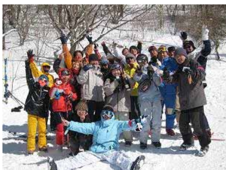
国际交流滑雪旅行