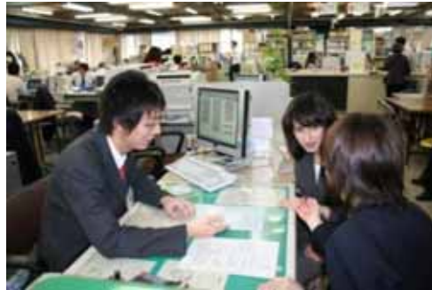
翻译志愿者的活动