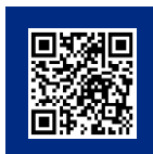
参加申込み フォーム