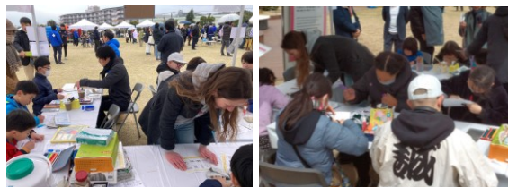
Mitakaみんなの防災フェスタ、MISHOPブースの様子